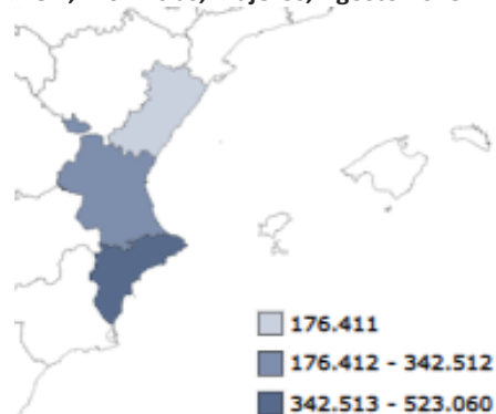
EOH, Provincias, Viajeros, Agosto 2018